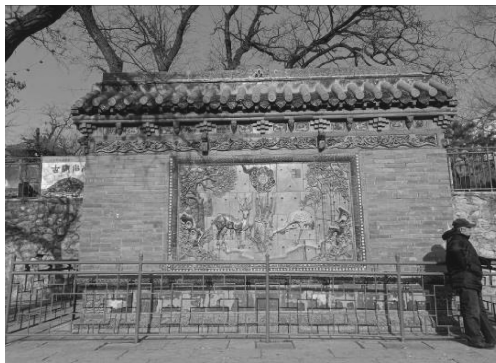
图4 厝石山公园内的琉璃影壁

琉璃影壁是公园内一处极具特色的标志性景观(见图4),位于公园正门附近。琉璃影壁建于清道光二十一年(1841年),由基座、壁身、壁顶组成。壁顶为起脊两坡式,脊饰卷云形绿琉璃砖,脊下为绿釉琉璃瓦垄。檐头有圆形瓦柱和滴水瓦,两端分设鸱吻。