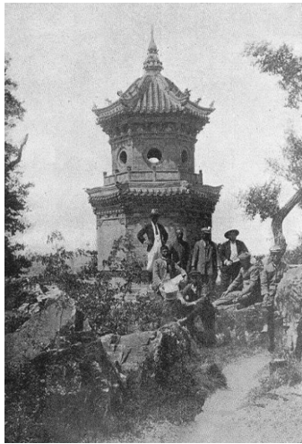
图2 厝石山公园字纸炉

铭曰“大金天命十年癸亥年牛庄城”。山坡上建有一座字纸炉,现今又叫“喜出望外佛塔”,高约10 m,形状尖削如塔形(见图2)。炉内分上下两层,上层供奉玉佛,下层供焚烧字纸所用。此处由于有他山诗社的集会和一些文人雅集活动,行人往来不断。字纸炉西北方向不远处为歌风亭,亭东北有小潭,四时不涸。公园虽小,却具大观。