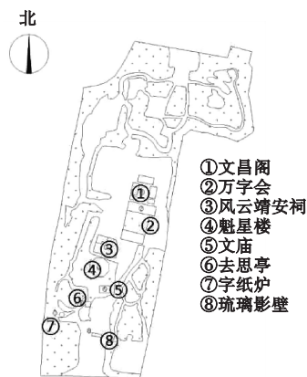
图3 当代厝石山公园平面布局

纵观其发展史，厝石山公园始建于清末，民国时期奠定了基本格局。在此之后虽然有所增减，但其整体风貌并没有较大改动（见图3）。如今的厝石山公园，绿荫如盖，花团锦簇，历尽沧桑的古老建筑巍然矗立，焕发着勃勃生机。