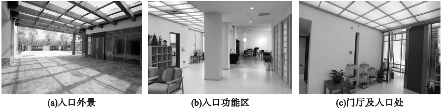
图3 北京康语轩俱乐部孙河老年公寓实景

氛围的意识,也没有从老年人的需求与喜好出发进行色彩设计,反映出色彩意识的不足 [3] 。目前,有部分养老机构都存在着同样的问题,在色彩设计方面没有切实从老年人的角度出发去进行考虑,长时间处于这样的环境会使老年人感到枯燥乏味。