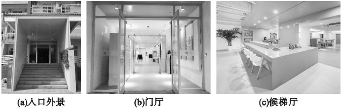
图2 北京邻里家养老公寓实景