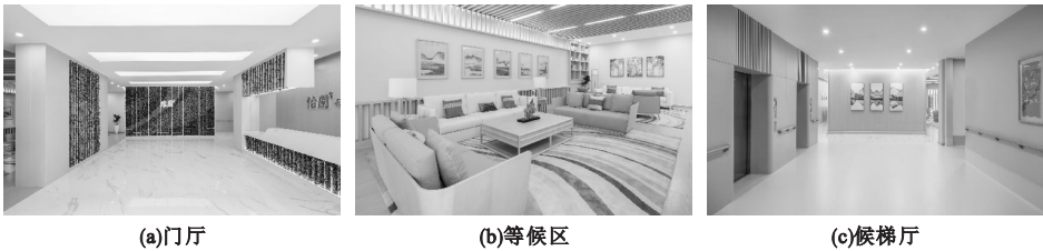
图1 天津万科怡园养老中心实景

天津万科怡园养老中心入口空间在色彩设计中的考虑相对全面,以木色搭配暖色系为主色调,除了运用浓淡相宜的色系、色调外,配合以灵动的绿色元素与象牙白营造美好的视觉感受,同时注重家具色彩的搭配以达到色彩平衡。设计中虽然已具备很强的色彩意识,但空间内色彩过于相近,一味追求形式与美观,扶手和其他安全设施的设置并不明显,不易于老年人识别和使用,且空间也不易于区分(见图1)。国内大部分养老机构的楼层和建筑形式都非常相似,老年人在养老机构内独自行走时,很难找到清晰的参考物体,难以识别空间,因此,老年人经常会走错楼层和区域,很容易发生危险。