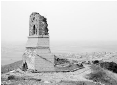
图1 七星山上残存的辽代佛塔

石佛寺乡的历史文化遗存丰富,文化底蕴深厚。村落起源于夏朝,辽代名为时家寨,是辽代双州辖境内一个重要的村寨,境内有辽代时期建立的城堡——双州城遗址 [10] 。目前城墙保存基本完好,瓮城遗址部分破损。明代为辽东的边墙,是位于沈阳北部的一个军事要地。清代则更名为石佛寺。石佛寺是古今水陆交通要塞,尚有各个时期保留下来的历史遗迹,成为该村的特色历史文化景观,包括青铜器时期遗址和墓葬、辽代佛塔(见图1)、辽代双州城遗址、辽代双州县官府遗址、军事碉堡群、清代古井、辽河古渡口、明代长城遗址、明代古烽火台遗址、明代十方寺堡遗址、解放战争末期碉堡群、锡伯族民居、西迁纪念馆、七星山风景区、石佛寺古刹。这些历史遗迹的保存与记载丰富了石佛寺古村落文化,促进了锡伯族文化的历史传承与发展。