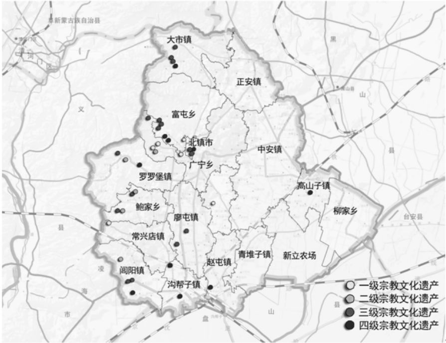
图 1 宗教文化遗产级别布局

“双心”是指北镇市城区的宗教文化遗产综合保护中心和以医巫闾山佛教资源为核心的宗教文化遗产开发利用中心。地处北镇市城区的大都为明清年间遗存的宗教文化遗产,有佛教的观音阁、道教的北镇庙、伊斯兰教的广宁清真寺,还有天主教堂、基督教堂等。各个教派在北镇市区共生发展。该地区应结合现代化城市的发展,结合不同教派的典型特征,综合考虑教派之间的区别与联系。突出开发利用的遗产保护模式赢得一定经济效益,从而带动周边地区宗教文化遗产的保护。