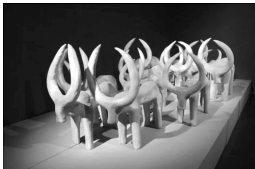
图8 陶艺雕塑《中国牛》