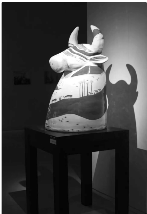
图9 陶艺雕塑《农耕时代》