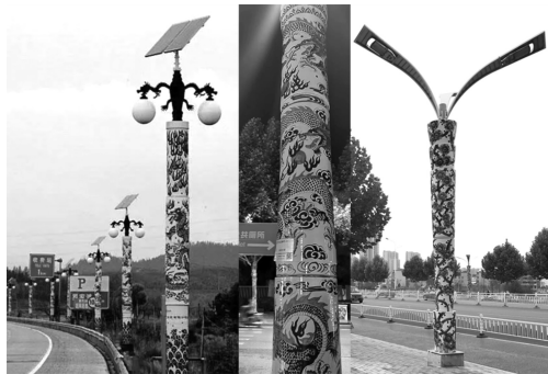
图6 景德镇的陶瓷灯柱