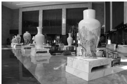
图1 北京诺金酒店大堂陈设的瓷瓶

环境陶艺作为陶艺发展的新产物,是现代陶艺衍生出的一种艺术表现形式,也是社会、环境、陶艺共同进步的产物。齐彪教授在其著作《现代陶艺论》中指出:“环境陶艺是指在城市公共空间设立陶艺或以陶艺为主的艺术作品。”环境陶艺作为一种新的语言表达形式正迅速走进公众的生活,它是人、环境、陶艺三者和谐共存的艺术,是陶艺匠师们借助陶瓷材料为环境空间创造的艺术 [4] 。环境陶艺以多样化的表现形式存在于城市环境的公共空间中,为表达地域性文化创造了新的范式(见图1)。