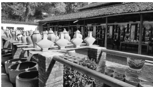
图2 景德镇古窑民俗博览区自然晾晒的陶坯

老子的著作《道德经》中记载:“域中有四大,而人居其一焉。人法地,地法天,天法道,道法自然。”这一论点强调人应该遵循自然规律,充分利用环境与材料技术,制作出符合需求、适应时代的工艺品,体现了尊重自然、顺应自然的重要性 [5] 。“仁爱”是孔子思想的核心,以仁心待万物,这是孔子生态思想的终极归宿。“智者乐水、仁者乐山”将君子的性情与其对自然山水的欣赏联系起来,形成了以“比德”为基本特征的先秦自然美学思想。因此,尊重自然的生态观对于现代环境陶艺创作影响深远。应选择环境(光照、地势、空气、水分)适宜的制瓷地进行艺术创作,如在瓷都景德镇的古窑民俗博览区自然晾晒的陶坯(见图2),最大限度地利用自然采光和地理优势,因地制宜,因材施教,对生态资源循环利用,将尊重自然的生态观贯穿环境陶艺创作的始终。