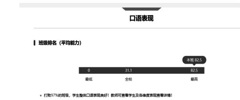
图 3 U 校园平台 A9 班口语表现

综上所述,本研究在沈阳建筑大学 2021 级学生中首次试用基于 SPOC 平台的大学英语视听说线上线下混合式教学模式,通过 2 个学期的实验数据比对分析,取得了较为理想的成绩: