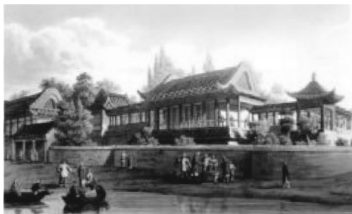
图4 海河楼绘画资料

色,楼内恭贮高宗纯皇帝御题海河楼匾额,御制诗章,对联,木刻”,是园内建筑体量最大、建筑结构最为复杂的建筑。海河楼(见图4)是一座卷棚歇山顶的建筑 [6] ,并且清代诗词中关于海河楼大都围绕“红楼”“朱栏”“红窗”这几个关键词来进行描述,因此,海河楼应该是一座五开间、卷棚歇山顶的红色建筑。海河楼的正后方是方形水池,设计师引园外之水入园成溪再成池,小溪上建有拱桥,池边种植垂柳并堆石成山。水池的东侧是高低起伏的廊庑,西侧则是一处御座房,北侧为一个“凸”字形的小院落,院落中央摆放置石。而整个海河楼园林的西侧是一个相对独立的小院落,院落东侧一角为一处假山,西侧为一处虎座屏门。