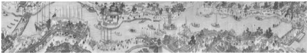
图 1 三岔河口的繁华景象

明末清初,由于天津水利交通便利,盐业日产丰盛,使得其成为了长芦盐业的转运中心。作为天津地区的重要经济产业,长芦盐业的大幅度发展大力推动了天津的城市建设。康乾时期,驻津盐官与盐商借助其雄厚的资本,以多种方式参与了天津的城市建设,建造了许多独具特色的园林与建筑。并且为了获得更高的社会地位,资产丰厚的盐商还会组织捐赠予皇家,参与皇家园林的修筑 [3] 。