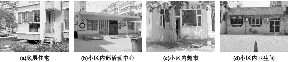
图 4 小区级老幼互助建筑可利用的空间

(1) 院落老幼互助空间,指与小区内部院落广场、道路绿地等空间结合设置的互助空间(见图 4),具有分散性和灵活性,宜采用小规模改建或加建模式。互助建筑与院落结合的模式主要有:对小区内底层商业或底层住宅进行改建;小区内部院落新建建筑;在小区内部卫生服务中心、图书室等已建小型设施中植入互助空间;建设临时性互助空间,加入座椅、幼儿活动设施等。