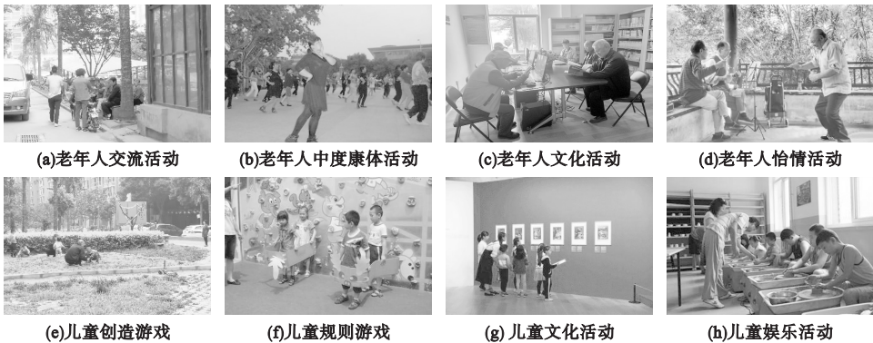
图 1 老幼行为需求

(2) 儿童行为需求。社区活动空间中的儿童可分为高龄与低龄儿童,高龄儿童包括学龄期儿童,年龄为 7~14 岁;低龄儿童为学龄前儿童,年龄为 3~6 岁。低龄儿童行为需求以各类游戏活动为主(见图 1(e)~(h)),