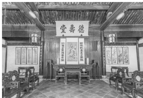
图4 周家老台门厅堂