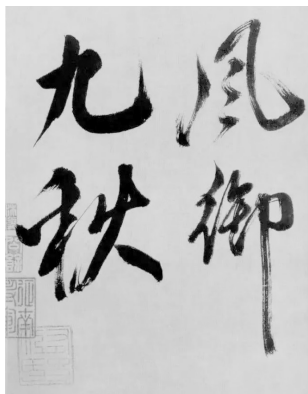
图10 《多景楼诗册》节选

运用笔墨章法元素的组合,营造出诗意画情的意境表现,与建筑空间所营造的艺术氛围相互调和,展现出蕴含无限力量的真实物象空间、情感空间形态。“知白守黑”的布局手法不仅在建筑空间艺术、书画艺术中得到广泛应用,更是空间艺术氛围营造过程中举足轻重的表现形式。这种美学思想与西方形式美法则相结合,以室内的软装饰设计来营造空间艺术氛围更是锦上添花。通过书画艺术表现建筑空间的环境氛围,与置身其中的人物产生心理上的共鸣,从而达到营造空间艺术氛围的目的。