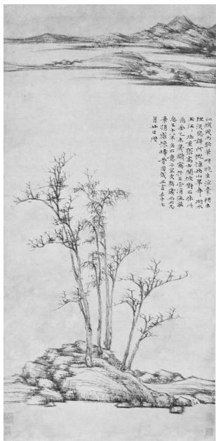
图1 倪瓒《渔庄秋霁图》

力与气在书画结构表现中,不在于画面四平八稳,而在于造奇与造险;画面重心不在中心,而是设计性的倾斜,但又绝不是倾倒,画面“紧张感”把持有度,将力与气的运用发挥到极致。力与气在书画笔墨运用中,需将全身之力汇入手臂,方可得写意之气势,突出