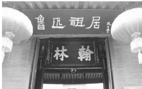
图3 周家老台门“翰林”匾