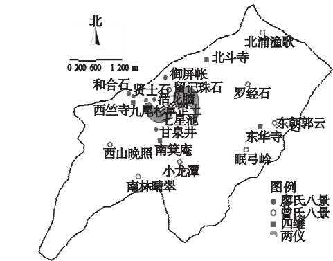
图3 三僚风水布局示意图

在我国公共园林中,用群山环绕形成远离喧嚣的世外桃源的做法不胜枚举。三僚八景位于山环水抱的中央,聚气而不散泄。在这四象围合的八景中,四周山、水、石、树围绕