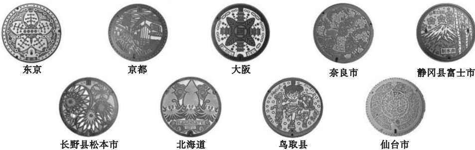
图5 日本井盖造型设计

在城市中,下水道系统可以说是貌不惊人的一处风景,实则井盖造型设计不仅可以加强历史街区的文化使命感,还可以帮助人们识别周围环境。在日本,井盖是一座城市的名片,是一种特殊的文化,其以不同自治市的文化背景、历史故事、风光名胜作为设计主题,井盖就会描述该地区的景点、信息、故事等(见图5)。在沈阳路的井盖造型设计中,商铺门口的井盖装饰可提供导向性标识信息,历史景观旁可设计著名地标,甚至可以用寓言故事、土特产、手工艺品作为题材,来凸显老沈阳的地域文化。这样的设计,无疑会让人眼前一亮,同时也会提升历史街区道路景观设计的趣味性及街区认知。