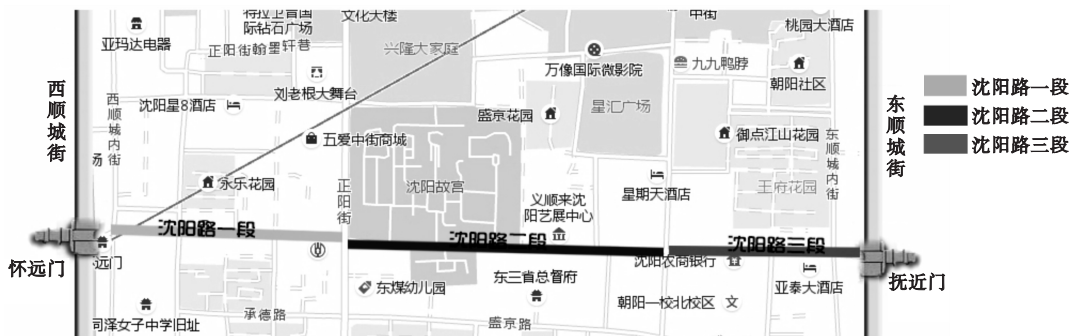
图1 沈阳路区位分析

很高的价值,以沈阳故宫为中心、襟带左右,沿街60多座仿古建筑与沈阳故宫映衬和谐,是与众不同的清代文化一条街。这条路不仅是沈阳城市历史的见证者,同时依托方城、中街商业圈,为自身带来了很高的旅游商业价值(见图1)。