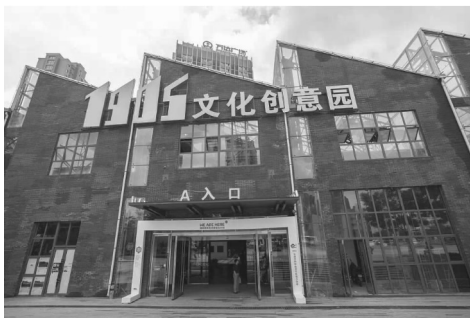
图2 1905 文化创意园