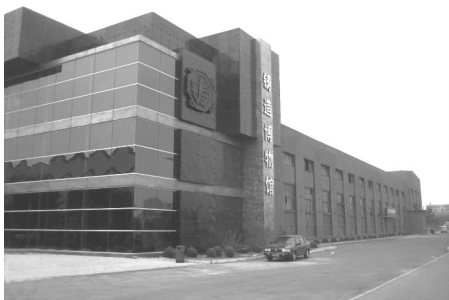
图1 沈阳铸造博物馆

随着“退二进三、东搬西建”发展战略的实施,原铁西工业区已被现代城市生活区所代替,大量的工业厂区、厂房、建筑设施等被拆除或破坏,但厚重的工业历史仍在铁西区大地上留下众多的工业遗迹,它们在沈阳工业发展的历史长河中留下深刻的印记 [3] 。铁西区内目前保留有沈阳铸造博物馆(见图1)、铁西工人村、由重型机械厂改造的1905文化创意园(见图2)以及红梅味精厂等较为集中的工业遗产片区。铁西区的工业遗产保护程度不一,例如,重型文化广场得到了保护与开发,红梅味精厂则不然。